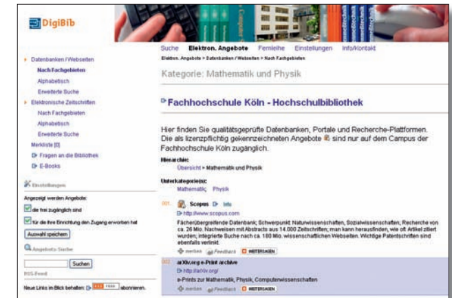
Elektronische Angebote (DigiLink) zu einem Fachgebiet (FHB Köln)

Anhand der Verfügbarkeitsrecherche wird Ihnen angezeigt, wie Sie zu Ihrer Literatur gelangen: ob der Titel online zur Verfügung steht oder ob er sich im Bestand Ihrer Bibliothek befindet. Besitzt Ihre eigene Bibliothek diesen Titel nicht, wird ermittelt, welche andere Bibliothek ihn über die Online-Fernleihe bereit stellen kann. Bei Büchern wird Ihnen auch die Kaufmöglichkeit über Online-Buchhändler angeboten.