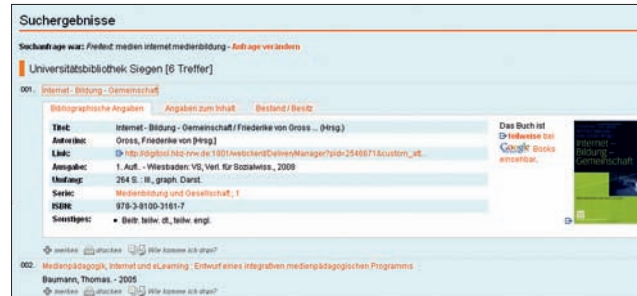
Suchergebnisse und Einzeltreffer (UB Siegen)

Nach dem Login starten Sie Ihre Recherche in einem Datenbankprofil Ihrer Wahl. Die Suchmaske bietet neben dem Suchschlitz für die Freitextsuche auch weitere Optionen für die Eingabe Ihrer Suchbegriffe. Sie wählen passende Kataloge und Fachdatenbanken aus, je nachdem, ob Sie Bücher, Zeitschriften oder Aufsätze suchen.