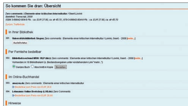
So kommen Sie dran – Ergebnis der Verfügbarkeitsrecherche (UB Siegen)

Der Einzeltreffer liefert zusätzliche Informationen, evt. Abstracts, Inhaltsverzeichnisse und Angaben zum Standort. Über einen Link zum Katalog Ihrer Bibliothek haben Sie ggfs. die Möglichkeit, den Titel zu bestellen oder vorzumerken. Bei elektronischen Quellen führt ein entsprechender Link zum Volltext.