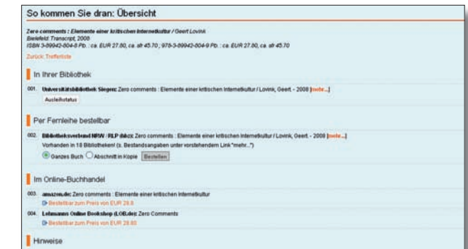
So kommen Sie dran – Ergebnis der Verfügbarkeitsrecherche (UB Siegen)